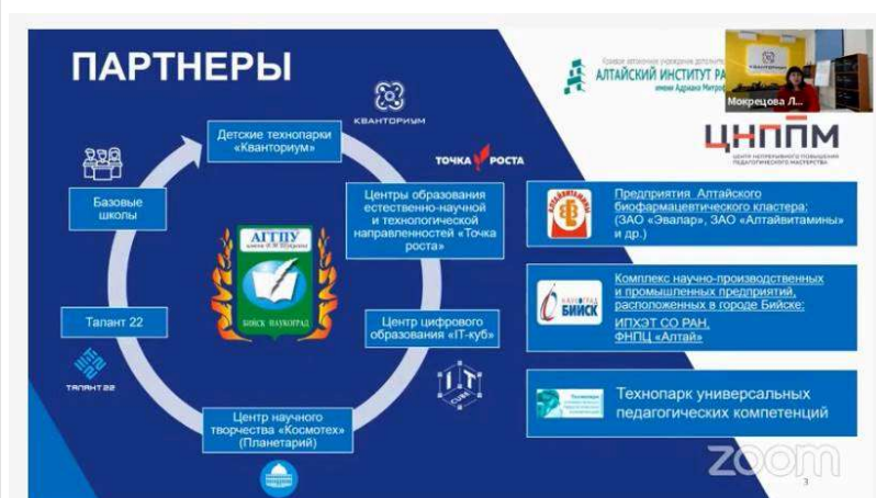
01.02.2022 Семинар «Вектор образования». Ядро педагогического образования.