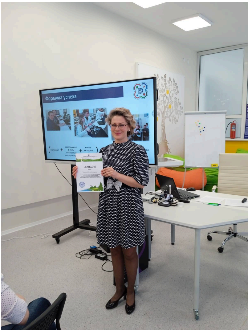
По завершению мероприятия всем вручили сертификаты, а выступающим дипломы участников семинара.