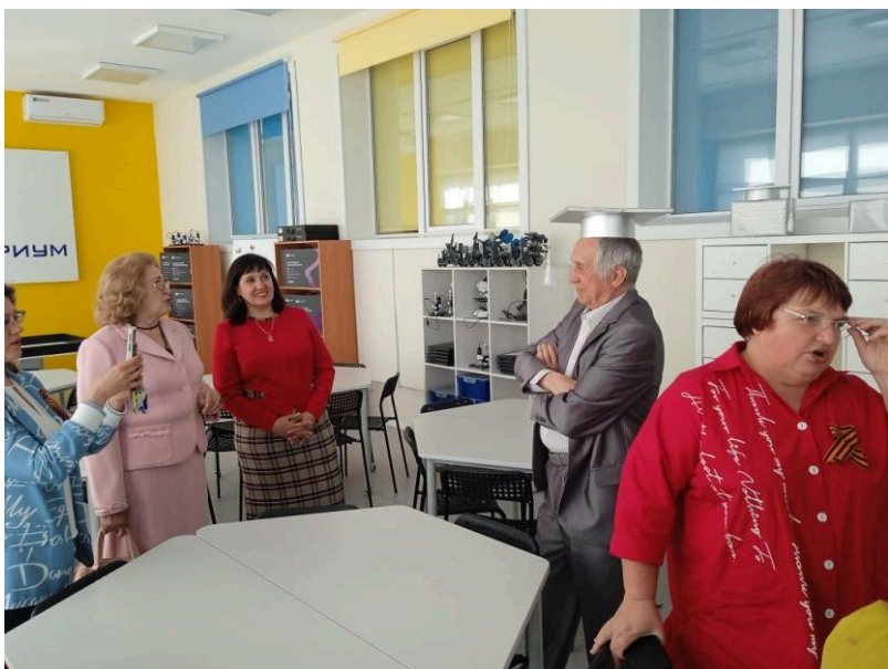
Продюсерский центр «Лаборатория-медиа» (г. Санкт-Петербург) проводил съемку Педагогического Кванториума и Технопарка универсальных педагогических компетенций АГГПУ Шукшина в рамках цикла документальных фильмов «Города Петровы», приуроченного к 350-летию Петра I.