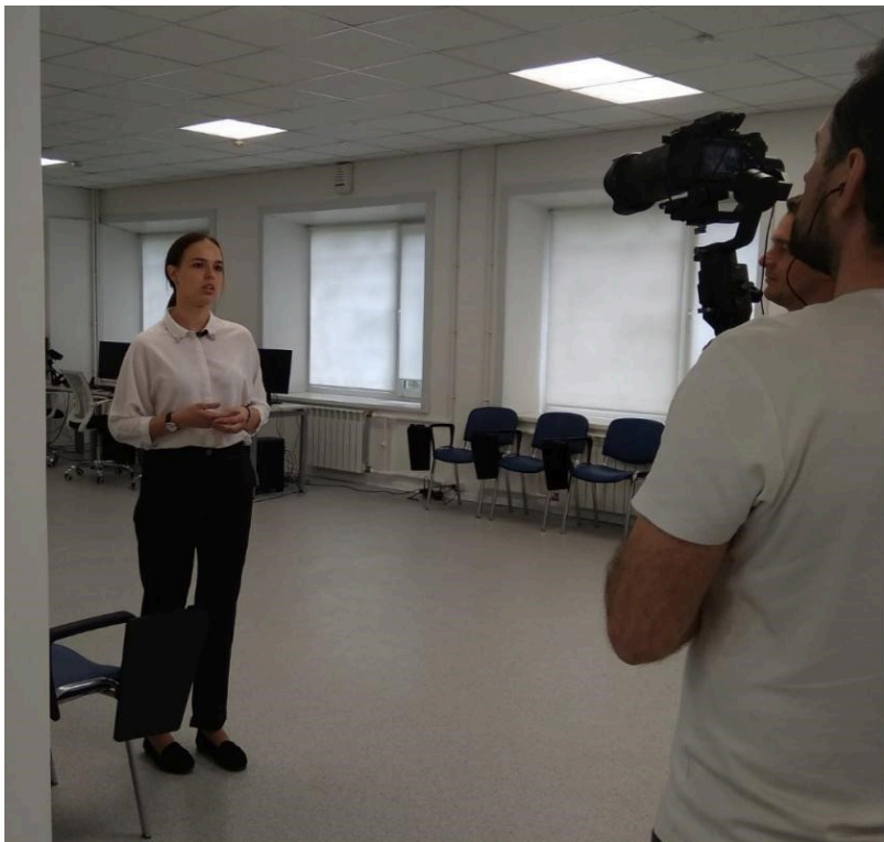
Команда продюсерского центра высоко оценила уникальность работы Кванториума и Технопарка, отметила огромную значимость создания инновационных площадок в Университете Шукшина для будущих педагогов и для Наукограда. Помимо нашего университета команда проекта планирует работу на объектах, составляющих культурную и общественно-значимую ценность, как для Бийска, так и для Алтайского края в целом.